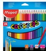
Lápices de colores $12.599