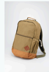
Mochila “Tierra” $60.800