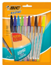
Lapiceras de colores $6.880