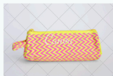
Cartuchera “Primavera” $8.750